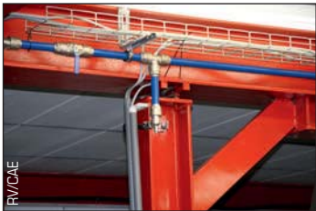
Détail du système d'air comprimé.

Cette gamme de produits est commercialisée dans toute l'Europe – et plus spécifiquement en Belgique, en France, aux Pays-Bas, en Suisse, au Danemark et en Norvège – via des canaux de distribution. La production de pèse-personnes médicaux est en croissance constante dont 60% sont destinés à l'export. Une dizaine de personnes travaillent dans l'entreprise.