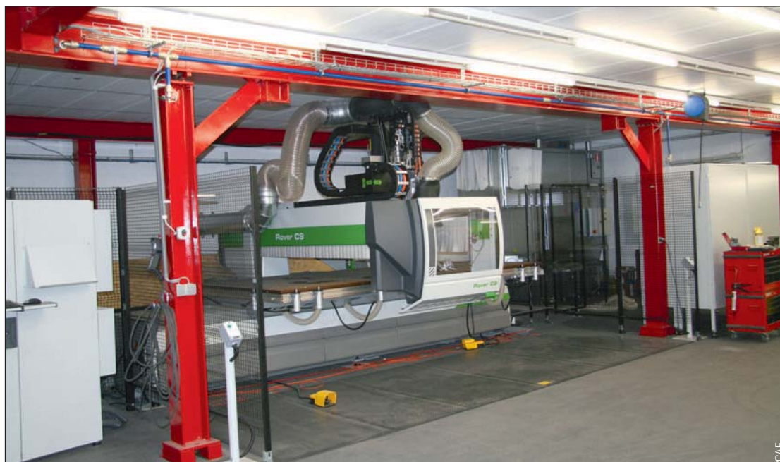
Une des machines à commande numérique de CAE, servant à la fabrication en série de pèse-personnes pour le secteur médical. Voyez la conduite (en bleu) du réseau d'air comprimé sur la partie supérieure du châssis orange.

Suite à la forte croissance des activités dans le domaine des pèse-personnes pour le secteur médical, avec des ventes dans toute l'Europe, C.A.E. a décidé de suspendre ses activités d'automatisation et de se concentrer sur ces systèmes de pesage médicaux. La gamme de pèse-personnes pour le secteur (para-)médical a systématiquement été étendue à tous les modèles demandés par les hôpitaux: des balances pour bébés, des pèse-personnes déplaçables pour les patients en fauteuil roulant, des balances capables de peser le lit entier du patient (utilisé dans les divisions de dialyse rénale, pour le contrôle du poids du patient avant et après la dialyse, le système étant compatible avec les logiciels de dialyse rénale)... En investissant dans de l'équipement de production permettant de réaliser des formes plus complexes, l'entreprise accorde une grande importance à l'esthétique ainsi qu'aux matériaux utilisés pour les produits qu'elle fabrique car les hôpitaux y sont assez sensibles.